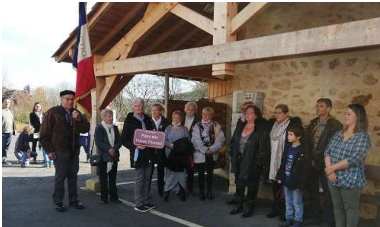
INAUGURATION DE LA PLAQUE COMMEMORATIVE LE 11 NOVEMBRE 2021 EN PRESENCE DE LA FAMILLE THURMEL

Un monument commémoratif, dit « Mur des fusillés », fut élevé en 1954 (délibération du conseil municipal des 21 et 27 mars 1952) sur ces lieux (rue du 5 e Régiment-de-Chasseurs), où quarante-cinq résistants furent exécutés du 19 juin au 24 août 1944.